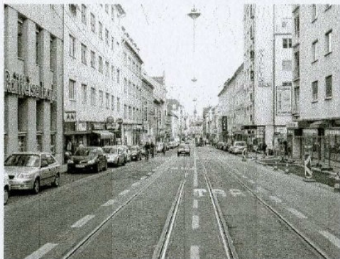
Die Lage in der Annenstraße bleibt weiter trist.